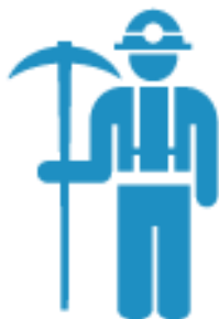
宿泊施設や観光施設などの建設業