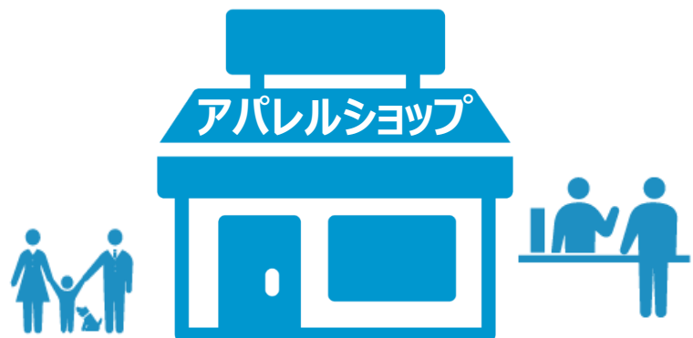
アパレルショップの経営